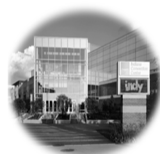
INDIANAPOLIS CONVENTION CENTER 100 South Capitol Avenue • Indianapolis, IN

Doă persoane mor în fiecare secundă, pe glob și cei mai mulți din cei ce mor nu cunosc pe Domnul nostru Isus Hristos! ca Mântuitor — Fii un martor bun al Domnului Isus !