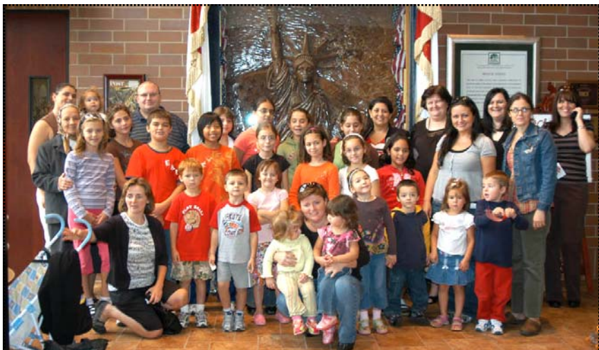
Lunea trecută la „Chocolate Factory” lângă Statuia Libertății din ciocolată